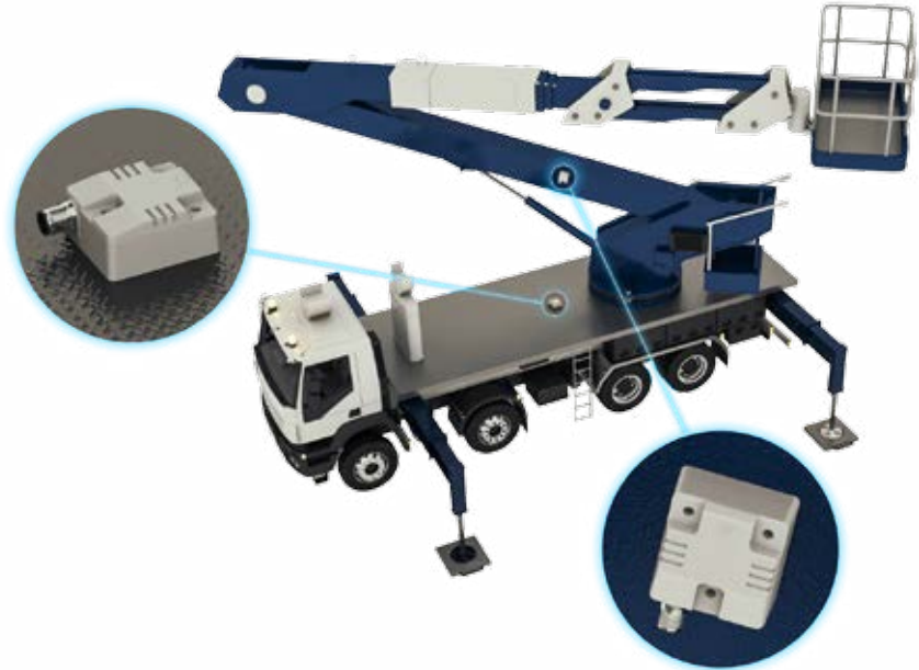
GIM500R : mise à niveau de véhicules et positionnement de bras

La nouvelle série GIM500R est parfaitement adaptée aux applications à espaces d'encastrement restreints dans les machines lourdes et les véhicules mobiles.