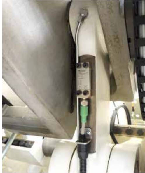
Auf dem Kniehebel überwacht der Dehnungssensor DSRT von Baumer die Schliesskraft der RDM-K Maschinen zuverlässig und sicher.

nicht über die Toleranzgrenzen hinaus bewegen. Bei Abweichungen kann sie am Bildschirmbedienfeld vom Maschinenführer unmittelbar korrigiert werden. Das verhindert die vorzeitige Abnutzung der Form- und Stanzwerkzeuge und stellt gleichbleibende Produktqualität sicher. Der DSRT ist langzeitstabil. Einmal eingestellt, garantiert er dauerhaft präzise Messungen.