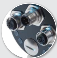
3 x M12