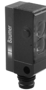
图片与实际产品类似