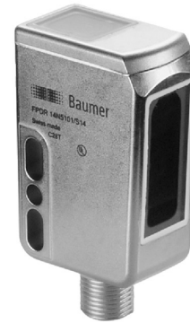
图片与实际产品相似