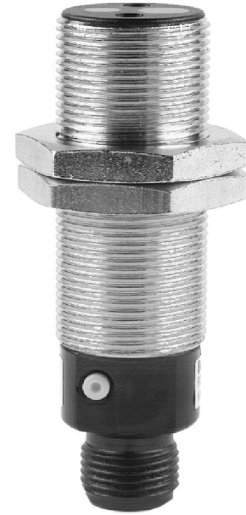
图片与实际产品类似