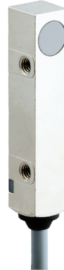
图片与实际产品类似