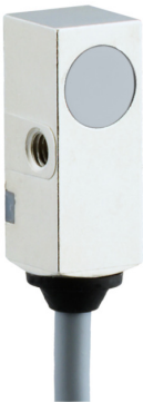
图片与实际产品相似