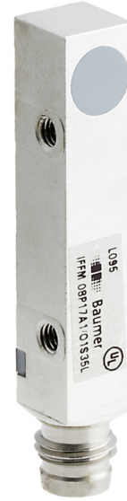
图片与实际产品类似