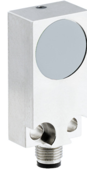
图片与实际产品类似