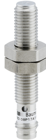
图片与实际产品类似