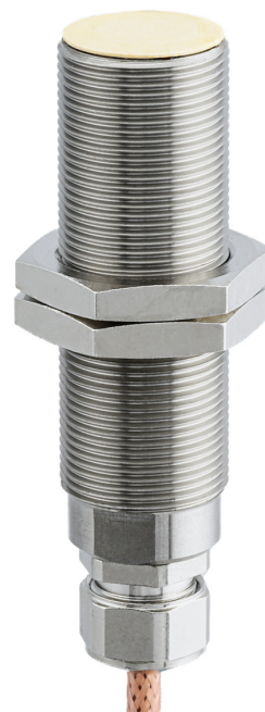
图片与实际产品相似