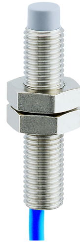
图片与实际产品相似