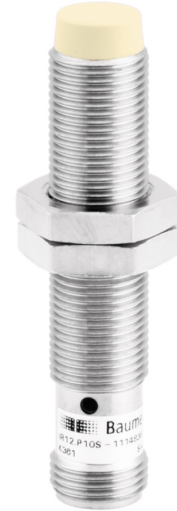
图片与实际产品相似