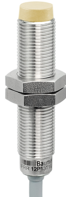
图片与实际产品相似