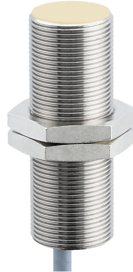
图片与实际产品相似