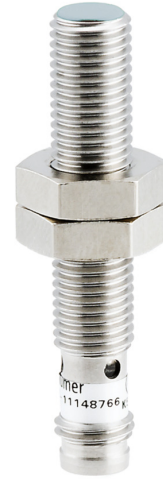
图片与实际产品类似