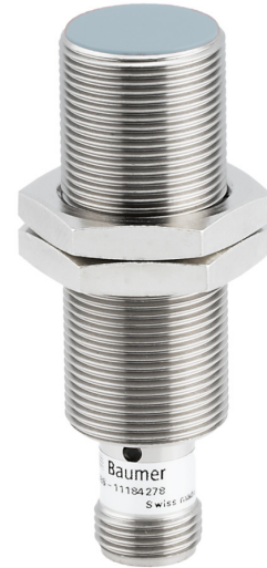
图片与实际产品相似