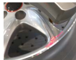
汽车工业 3D 表面检查