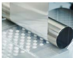
医药物流 包装过程中的产品跟踪