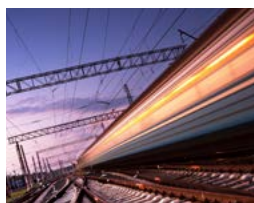
运输系统 铁路接触网检查