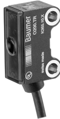
图片与实际产品相似