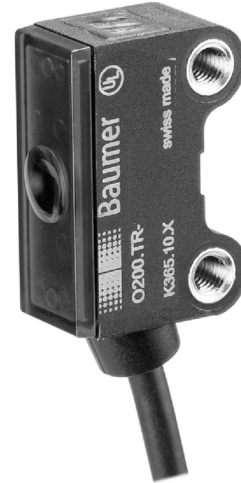
图片与实际产品相似