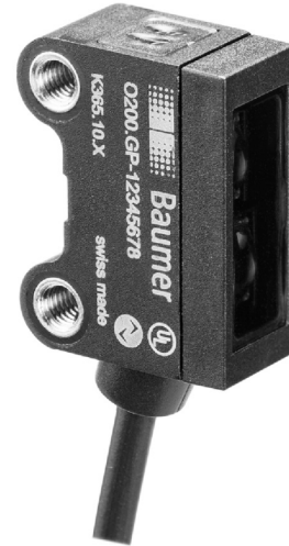
图片与实际产品相似