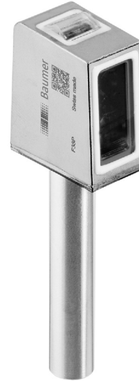
图片与实际产品相似