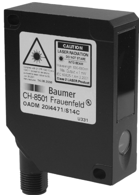
图片与实际产品相似