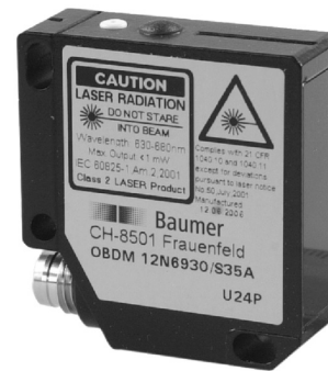
图片与实际产品类似