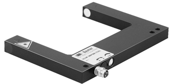
图片与实际产品相似