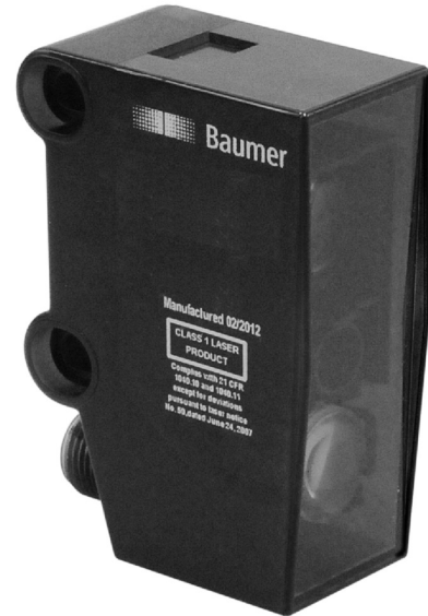
图片与实际产品相似