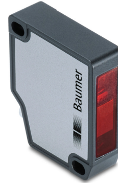
图片与实际产品类似