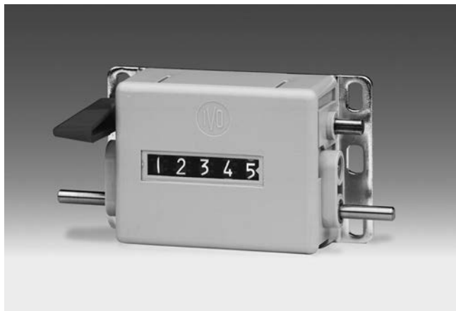
U 310 - Umdrehungszähler