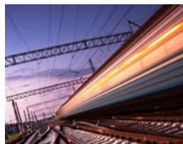
운송 시스템 예: 레일 라인 검사