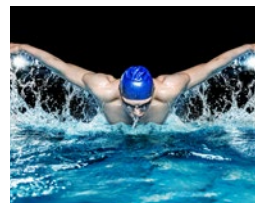
스포츠 예: 올바른 수영 동작 분석