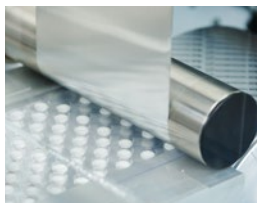
제약물류 예: 포장 과정에서의 트랙 및 추적