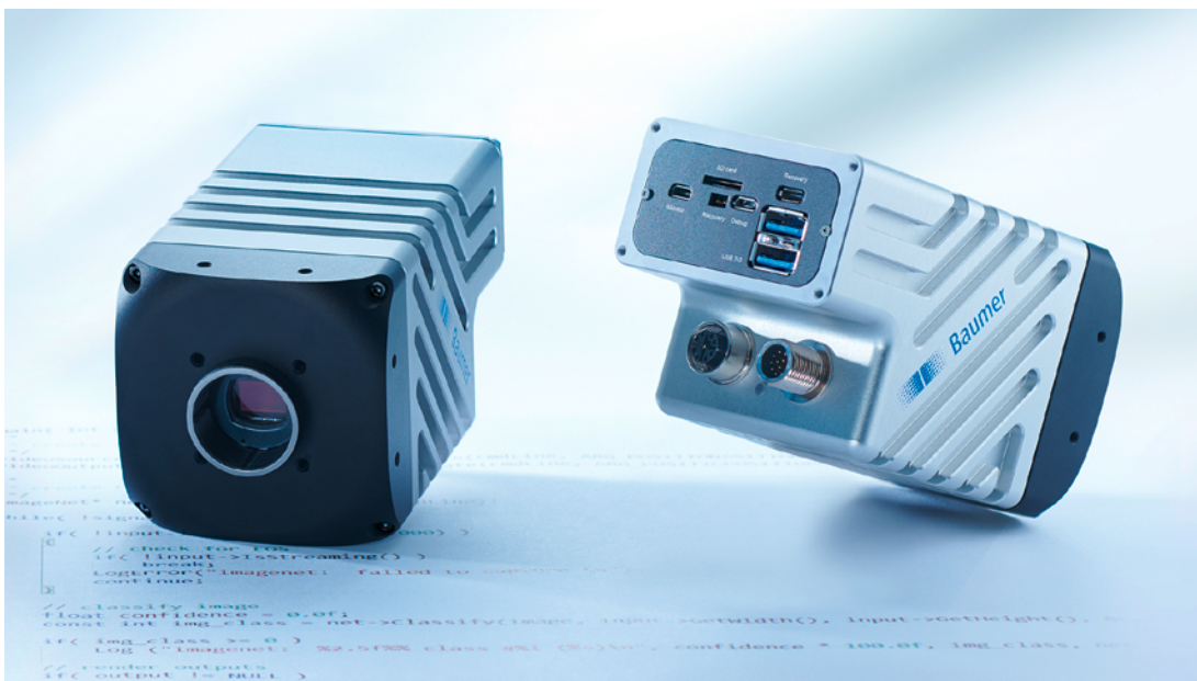
Bild 1: Die frei programmierbaren AX Smart Cameras kombinieren robuste Industriekamerqualität, marktführende NVIDIA® Jetson™ KI-Module und leistungsstarke Sony® CMOS-Sensoren zu einer frei programmierbaren Bildverarbeitungsplattform.

Der Markt für KI in der Bildverarbeitung wird weiter wachsen. Nicht verwunderlich – bietet sich die Bildverarbeitung mit ihren komplexen Bilddaten besonders für den Einsatz KI-basierter Algorithmen an. Unterstützt wird dies durch die zur Verfügung stehenden und einfach nutzbaren Software Development Kits (SDKs) wie TensorFlow und Caffe. Auch speziell auf Anwendungs-