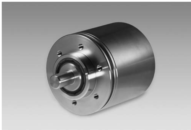
X 700 avec bride standard