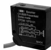
Schéma de raccordement