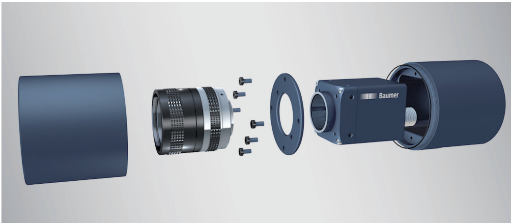
圆柱形 IP65/67 防护外壳表面经过硬质阳极氧化处理，可有效防止污垢堆积，甚至能承受高强度清洗。

保食品的安全生产，同时提供目前市面上最丰富的相机配件，从而为在苛刻环境下工作的相机提供定制化的一站式保护方案，这正好符合该系列相机的设计初衷。